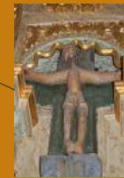
Santo Cristo de Belver