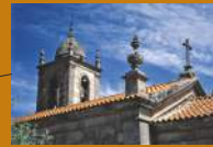
Igreja matriz de Pereiros