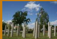
Museu Internacional de Escultura Contemporânea ao Ar Livre