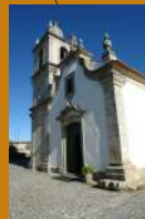
Igreja matriz de Carrazeda de Ansiães Santa Águeda