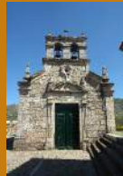
Igreja de Pinhal do Norte