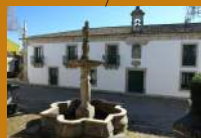
Fonte das Sereias