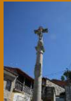
Cruzeiro de Codeçais