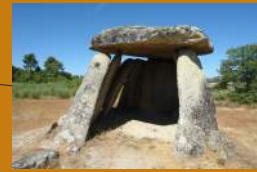
Casa da Moura - Anta de Zedes